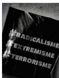
#Radicalisme #Extremisme #Terrorisme Bilal Benyaich